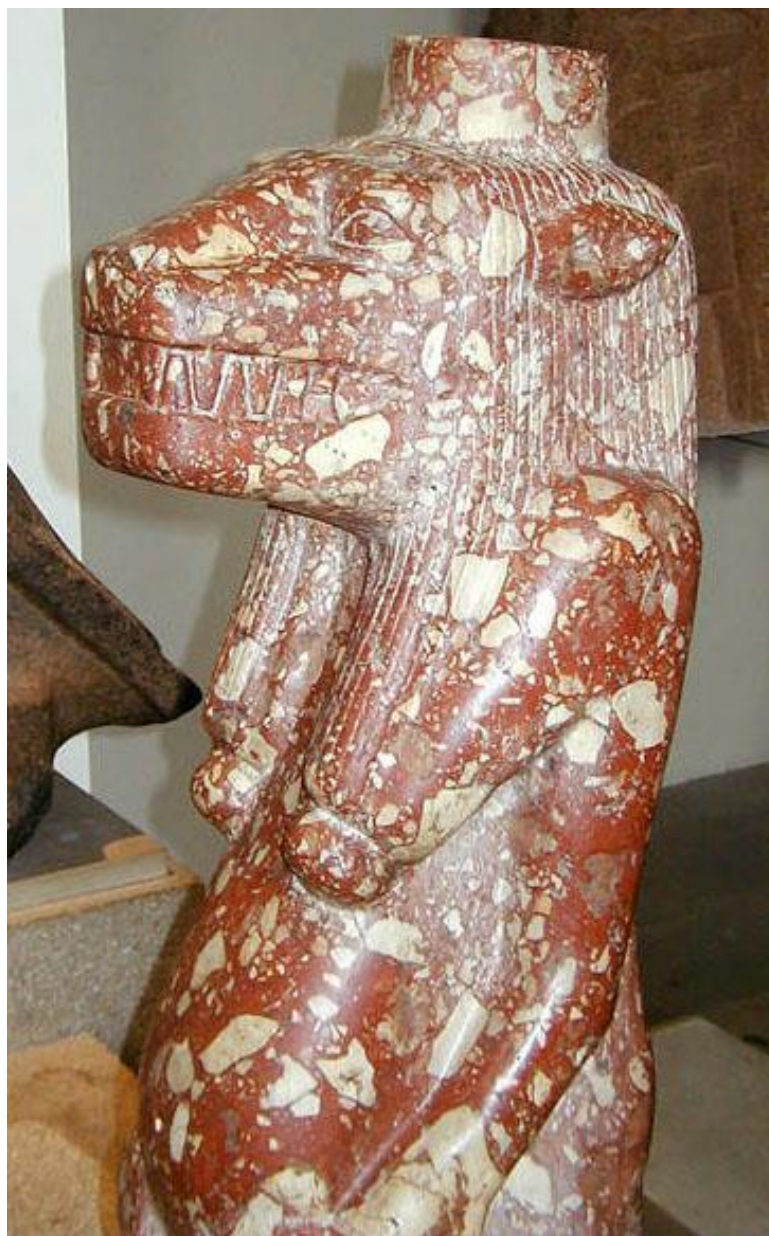
Рис. 5. Сосуд в форме бога Туарета. Древний Египет. Мраморная брекчия. Лондон, Британский музей

известные приемы и в использовании текстурного рисунка материала» [3]. Дошёл до наших дней метод инкрустации глаз персонажа скульптурного изображения. Он применяется в полихромной пластике отечественных мастеров и, как и тысячи лет назад, оживляет взгляд каменных статуэток. Поэтому, останавливаясь сегодня на этой культуре, мы возвращаемся к истокам художественной обработки камня, дополняя историю этого материала яркой страницей его «творческой жизни».