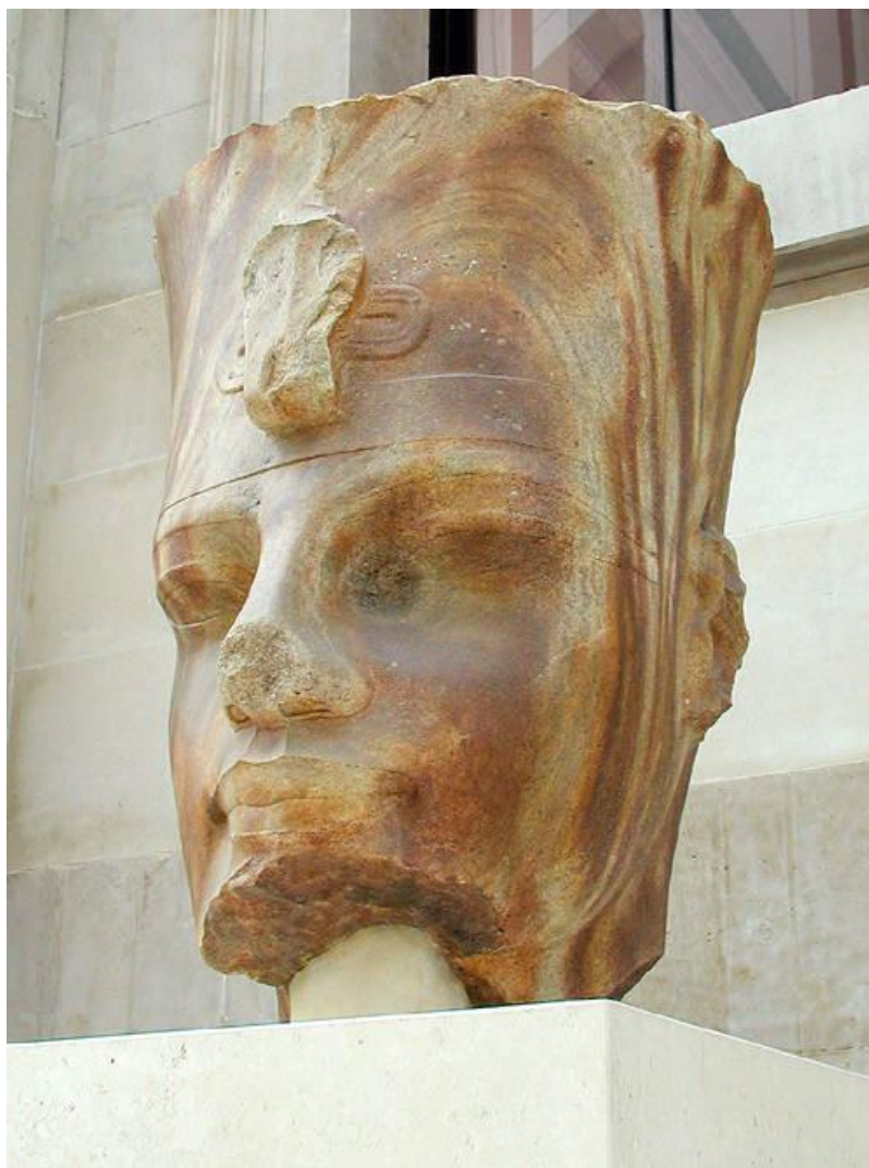
Рис. 3. Голова фараона Аменхотепа III. Древний Египет. Кварцит. Лондон, Британский музей

В собрании Британского музея находится ваза в форме птицы, выполненная из мраморной брекчии (рис. 4). Брекчия представляет собой горную породу, состоящую из сцементированных пород или минералов. Обусловленный происхождением камня текстурный рисунок содержит пятна различного размера светло-охристого тона, перемежающиеся с более тёмными вкраплениями. Светлые и тёмные пятнообразные включения с резкими очертаниями, образующие текстурный рисунок камня, украшают пластическую форму птицы, добавляя произведению элемент декоративности. Широкая полоса из сцементированных включений обвивает шею и опускается на грудь пернатого персонажа. Разноформенные пятна украшают также спинку и короткий хвостик. Крупные светлые участки камня произвольной формы, выделенные тёмным контуром, расположены по бокам и выглядят своеобразной стилизацией крыльев. Такое распределение рисунка по пластической форме говорит о внимательном отношении древних художников к текстуре камня, являющейся средством выразительности в древнеегипетской