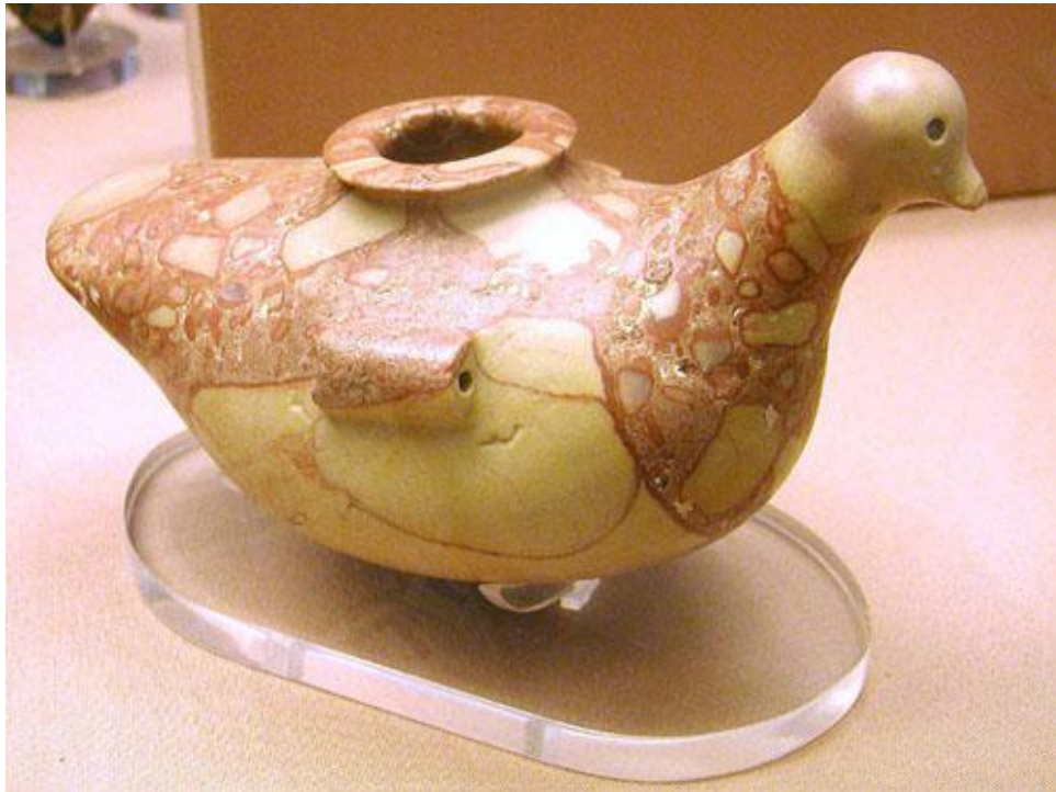
Рис. 4. Ваза в форме птицы. Древний Египет. Мраморная брекчия. Лондон, Британский музей

пластике. Обобщённая пластическая форма птицы дополнена стилизованным декором, в роли которого выступает текстурный рисунок брекчии.