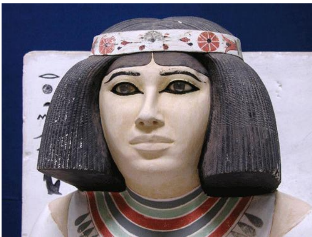
Рис. 2. Царевич Рахотеп и его жена Неферт. Древний Египет. Раскрашенный известняк. Каир, Каирский музей

Интересный образец раскрашенной скульптуры из камня с инкрустированными глазами – статуи царевича Рахотепа и его жены Неферт (рис. 2), находящиеся в Каирском музее. Хотя они сразу были задуманы как парные, каждая из скульптур абсолютно самостоятельна. Рахотеп и Неферт изображены сидящими на кубических с высокими спинками тронах. Одна рука